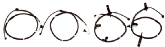
V8 VANTAGE 用 FRONT SET